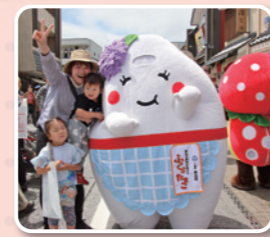
▲たまこさんと一緒にハイ、チーズ!