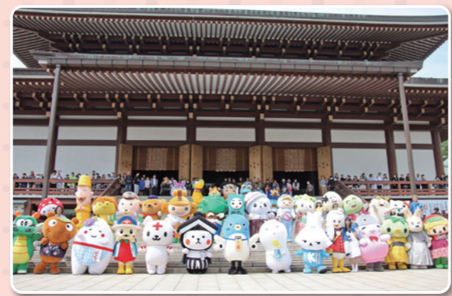
▲ゆるキャラみんなで成田山新勝寺を参詣しました!

5月23日(土)、24日(日)に成田山表参道と成田山新勝寺で「ご当地キャラ成田詣 うなふあん2026」が開催され、今年は過去最多となる約70体のゆるキャラが参加しました。2日間で約8万5千人が来場し、会場は大いににぎわいました。