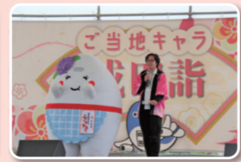
▲多古町の魅力をしっかりPR!