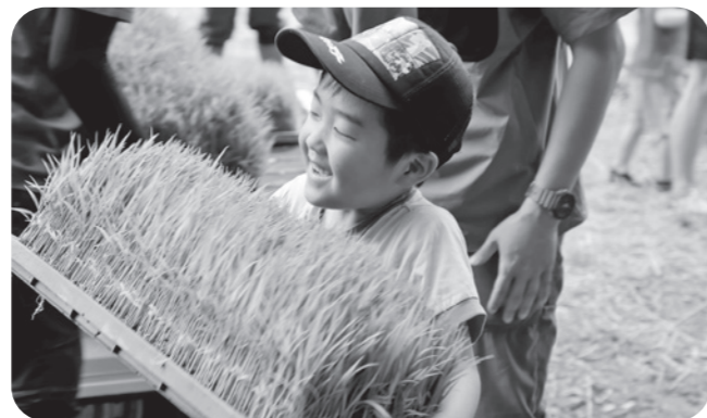
▲田んぼまで苗運びました