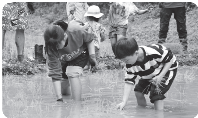
▲泥に足を取られながらも丁寧に

今後も、多古町観光まちづくり機構とANAアグリ部は、収穫体験など町の魅力を体験できるイベントを共同で企画していく予定ですので、ぜひご期待ください。