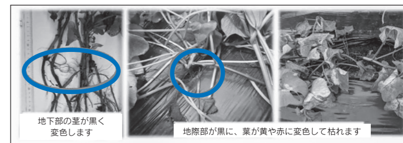
地下部の茎が黒く変色します

千葉県では、植物防疫法に基づき令和6年3月に「千葉県総合防除計画」を策定しました。近年全国的に問題になっている「サツマイモ基腐病」のまん延を防止するために、家庭菜園を含むすべての栽培者の方に6つのルールを守っていただくよう、ご協力をお願いします。