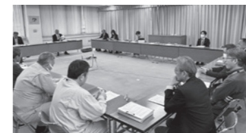
▲第5回意見交換会の様子