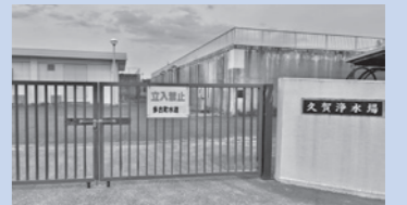
現在の久賀浄水場

令和8年度は、多古浄水場の高圧受変電設備の更新や取水井の設備更新、重要施設への配水管の耐震化などを行います。