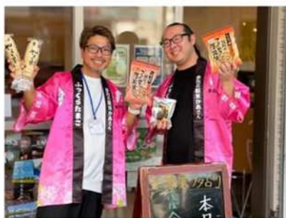
多古町町外PR 移住相談