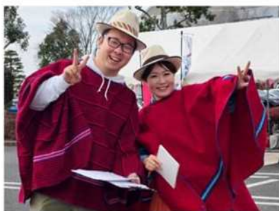
多古町観光まちづくり機構 イベント運営・企画