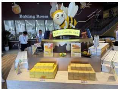
事業者の新規参入