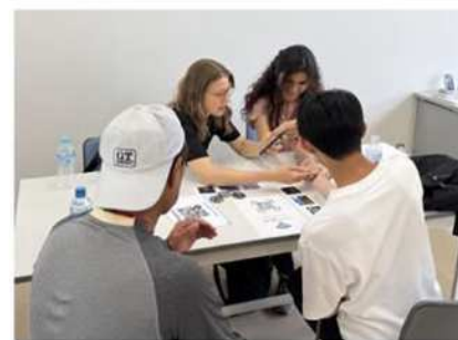
来訪者のおもてなし