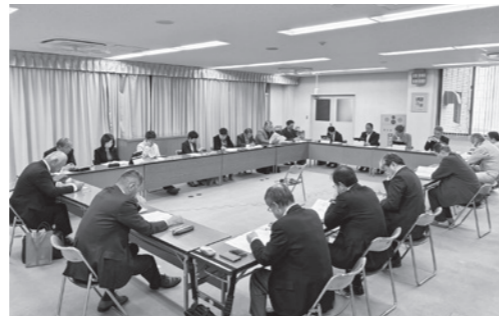
第4回意見交換会の様子