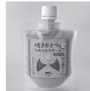
地域おこし協力隊による 「焼きおさつのなめらかクリーム」