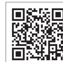
補助金の概要はこちらから

お問合せ●多古町農業連絡協議会事務局(産業経済課農業振興係) ☎ 76-5404