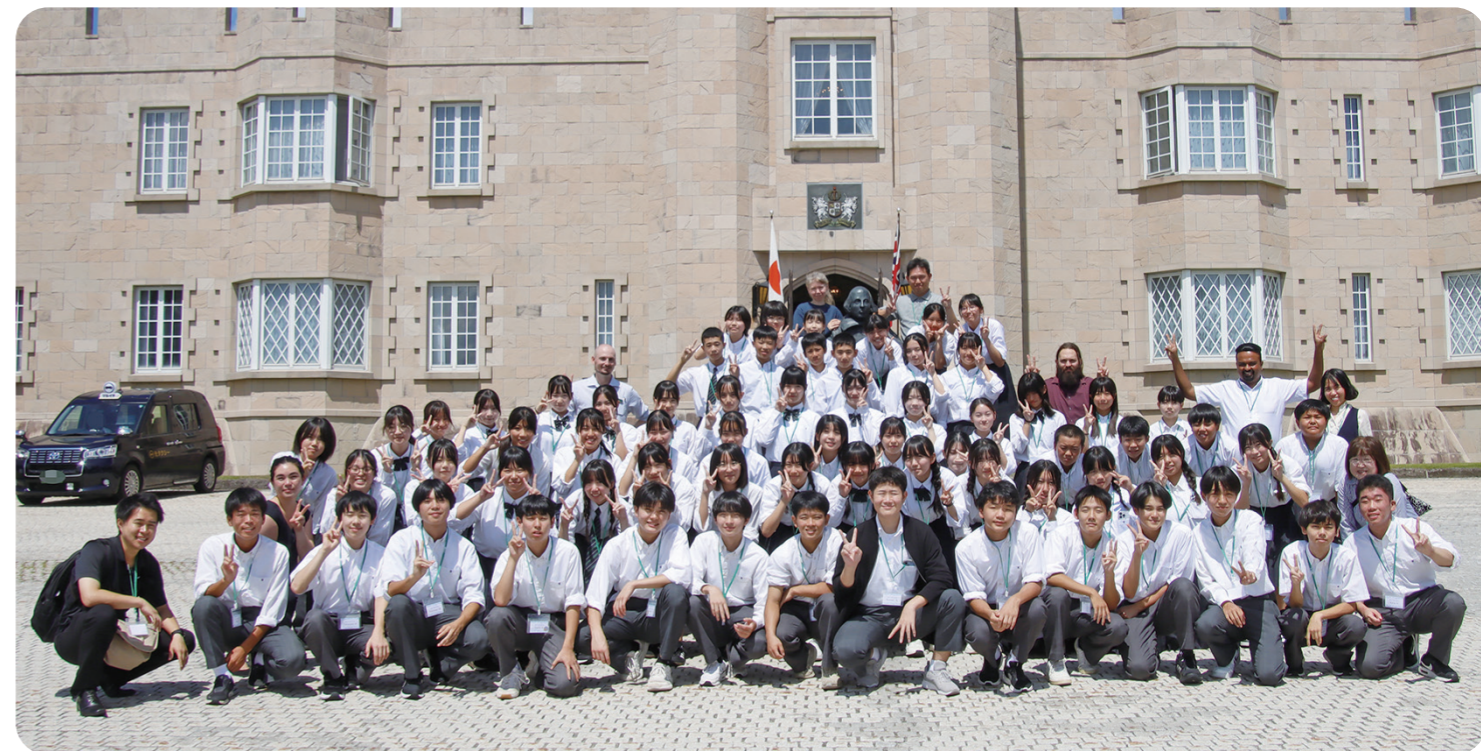
▲イングリッシュステイプログラムに参加した生徒の皆さん

引き続き、英語を使ってコミュニケーションすることを楽しみ、自己の考えなどを主体的に発信する力のある児童生徒の育成に取り組んでいきます。