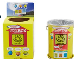
(一社) JBRC 回収BOX