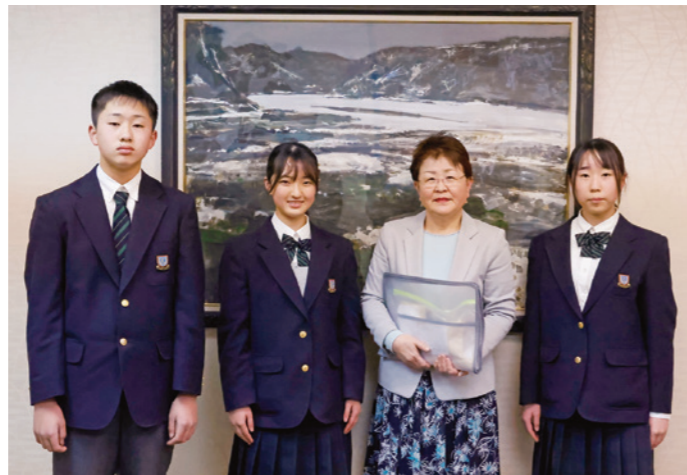
木川教育長と生徒会の皆さん

義援金は、町から日本赤十字社を通じて被災者へ届けられます。生徒たちの思いが被災地の皆さんの助けになることを願います。