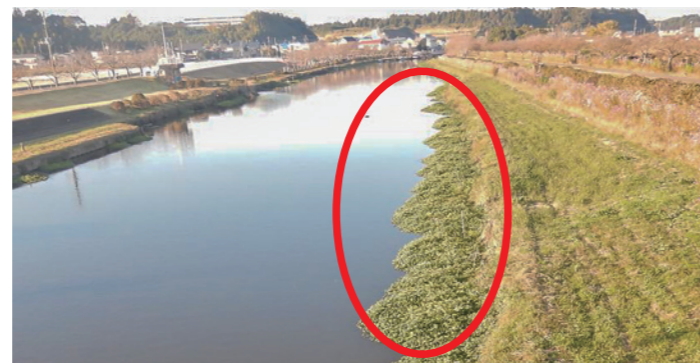
あじさい橋より撮影(令和4年11月)

町内の畦畔や畑地で「ナガエツルノゲイトウ」を見かけたら、早急に下記お問合せ先までご連絡ください。