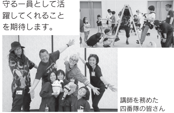
講師を務めた 四番隊の皆さん

プロジェクトの最後には隊員証が発行され、四番隊多古町支部の隊員になった子どもたち。町を守る一員として活躍してくれることを期待します。