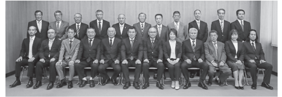
多古町農業委員会委員の皆さん

多古町農業委員会を構成する新たな農業委員12名と農地利用最適化推進委員11名をご紹介します。農業委員会は「農業委員会等に関する法律」に基づき各市町村に設置され、農地に関するさまざまな判断を行う役割を担っています。