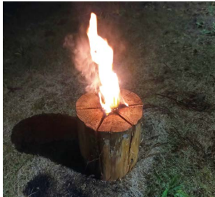
丸太から作る スウェーデントーチ

自伐型林業に関して 継続して取り組んでいる自伐型林業ですが、さらなる知識や技術を学ぶため、奈良県吉野郡で研修を受けてきました。 林業を幅広く捉え、伐木・搬出などにとどまらず、森林・樹木・木材に関するものとして、まき・丸太の活用や製材、小屋づくり、グリーンウッドワークなど、さまざまな知識や技術を学ぶことができました。 現在は学んだことを生かし、多古町や周辺地域での林業の力夕子を模索しています。桜宮自然公園や居住地区(次浦地区)などの山林で、下草刈りや枯木・風倒木の処理、空き家活用のために敷地内の整備などを行っています。木の活用として、丸太をまきにし、直接火を付けて暖を取ったり、煮炊きに使ったりすることができますスウェーデントーチを作成したりしています。