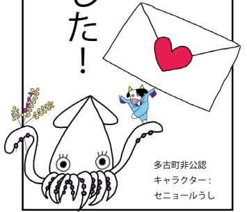
多古町非公認 キャラクター: セニョールラシ