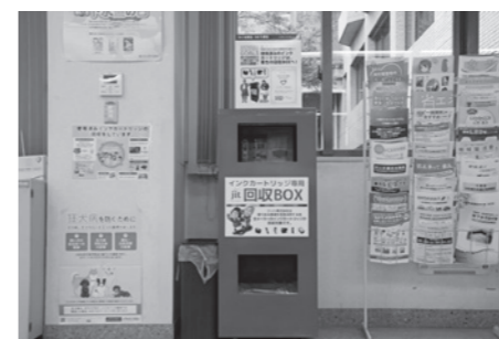
①役場1階生活環境課前