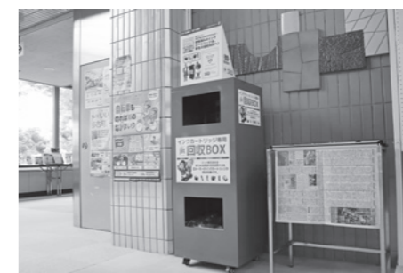
②コミュニティプラザ1階ロビー