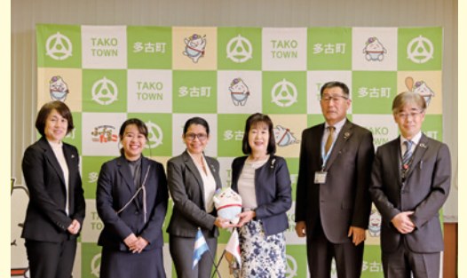
(左から3人目) サンディ・ダピラ サンドバル大使