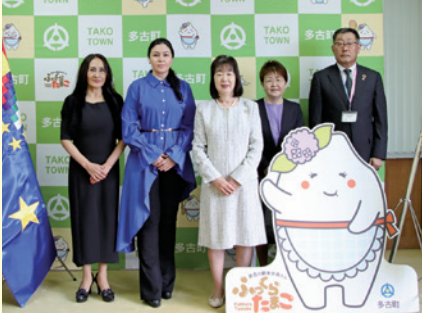
(左から2人目) ナターリア・サラサル臨時代理大使