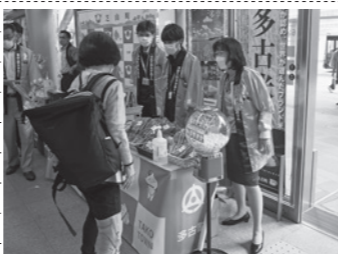
7日 春の行楽プロモーション in 千葉