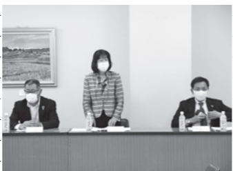
31日 多古町地域公共交通会議