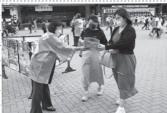
19日 ALL FOR CHIBA 2022