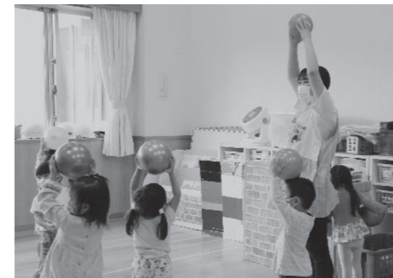
安心して利用できる環境づくりを

町長 現在、子ども園従事者80名に対する定期的なPCR検査は、実施しておりません。これは、検査の真の有効性を確保するには、毎日検査することが必要と考えられるからであり、毎日検査するには、物理的、経済的な面から限界があるからです。そこで、感染症の発症を