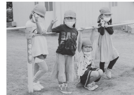
子育て支援のさらなる充実を

千葉No.1! 売り上げだけでも働きたい職場にしたいです。そのためには努力を惜しまない。