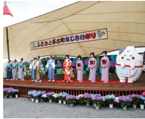
観光事業の発信を

町への経済効果は 町長 地方創生交付金を活用した古民家再生事業の大三川邸、一棟貸し宿泊施設としての運営と町への経済効果について伺います。