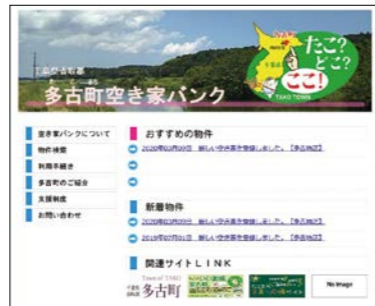
登録の推進が求められる空き家バンク

問 移住希望者の物件紹介の対応として、地域住民、民間業者、移住コーディネーターでの連携体制構築の考えは。 町長 地域住民、不動産業者の方と情報を密に取りながら、移住者の希望に合う物件の提供に努めてまいります。