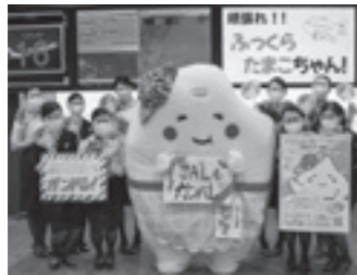
JAL 成田空港支店の皆さん

11月号のP3、JAL 成田空港支店の皆さん、ANA 成田空港支店の皆さんの写真の説明書きに不備がありました。お詫びして訂正いたします。訂正後の写真を掲載させていただきます。