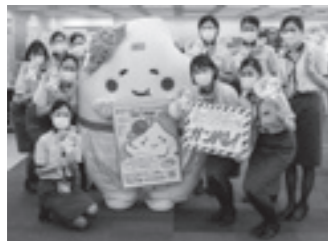
ANA 成田空港支店の皆さん