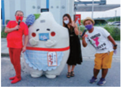
会場司会を務めたもくもくビーナッツさん(両脇)

多古町商工会青年部主催による「多古 DE 映画復活祭」(ドライブインシアター)が多古台バスターミナル駐車場で開催されました。新型コロナウイルス感染症拡大の影響により、多くのイベントや行事が中止に追い込まれる中、笑顔と活力を取り戻すことを目的に行われ、「ウイズコロナ時代」のエンターテインメントを楽しみました。会場には巨大なスクリーンが設置され、約140台の車が入場、町内外から多くの皆さんが映画を楽しみました。夏の夜の楽しい思い出が増えたことでしょう。