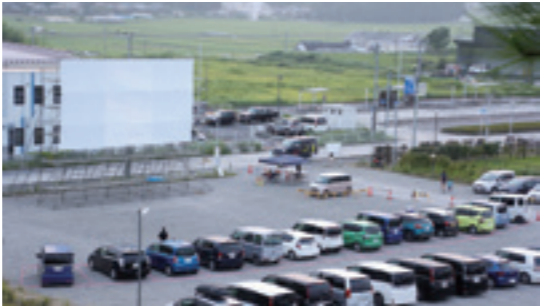
第1部で「ミニオンズ」、第2部では「ベット2」を放映