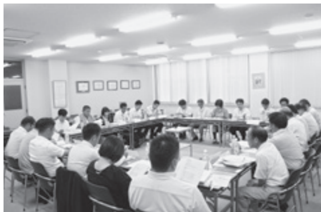
8月1日に開催した第1回審議会