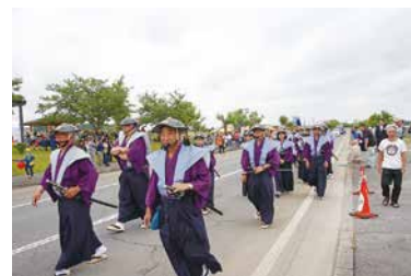
6/9 第35回ふるさと多古町あじさい祭り