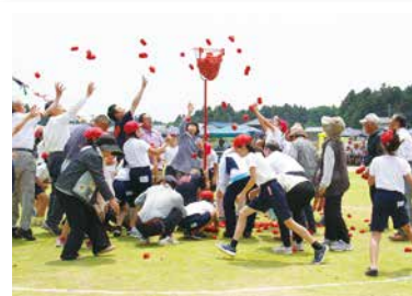
6/1 久賀小学校運動会