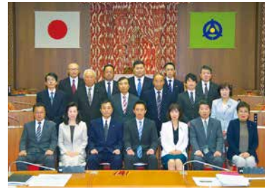
5/15 令和元年第1回臨時会