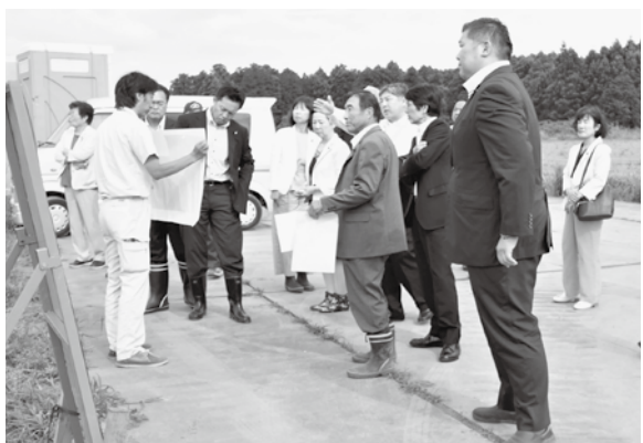
議員全員での埋立て現場の視察

問 今年度の水稲病害虫防除助成内容について伺います。 町長 農家負担軽減のため、無人ヘリコプター技術料金と薬剤代に対して予算の範囲内で昨年度以上の助成を予定しています。町植防で実施した場合も民間業者で実施した場合も同額の助成をしたいと考えています。箱施用、本田施用の薬剤費の助成は昨年同様水稲作付実施計画書を提出した方に購入代金の10%、10アール当たり上限500円を予定し、JA多古町からの購入だけでなく、町内の農薬取り扱い業者で購入した場合も対象とします。