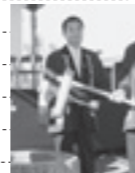
いきいきフェスタ TAKO2018