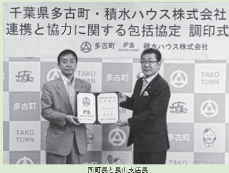
所町長と長山支店長

この協定は、「成田空港の更なる機能強化に対応するまちづくり、住宅・居住環境の整備及び企業誘致」のほか、「地方創生」や「少子化対策・子育て支援」など7項目について連携・協力することにより、町民サービスの向上や地域の活性化を図ることを目的としています。今後は、行政と民間事業者がもつ情報やノウハウを相互に活用し、魅力あるまちづくりを推進していきます。