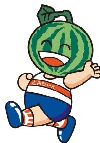
富里市 とみちゃん