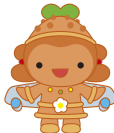
芝山町 しばっこくん