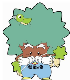
神崎町 なんじゃもん

A 3. 現状の番号のまま図柄入りナンバーに交換することができます。また、新しい番号を希望することもできます。