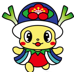
横芝光町 よこびー

A 1. 図柄ナンバーとは、地域振興や観光振興などを目的として、自動車のナンバープレートに観光地や名産などをデザインしたナンバープレートのことです。