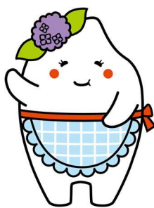
多古町 ふっくらたまご