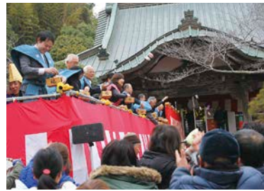
2/3 妙光寺節分会追儺式