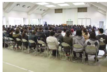
3/11 スポーツ優秀選手表彰式