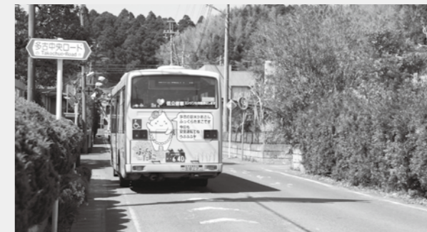
バスベイの整備で道路にゆとりを