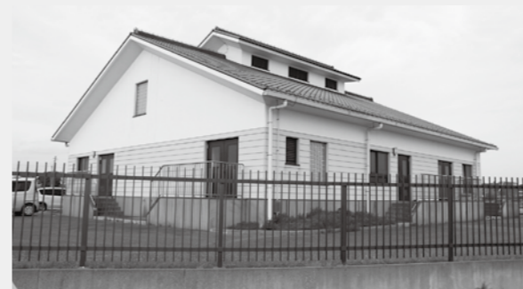
今後の設備修繕は(島地区汚水処理施設)

答 計画という形では策定はしていませんが、整備計画は今後立てていかなくてはならないという考えはあります。