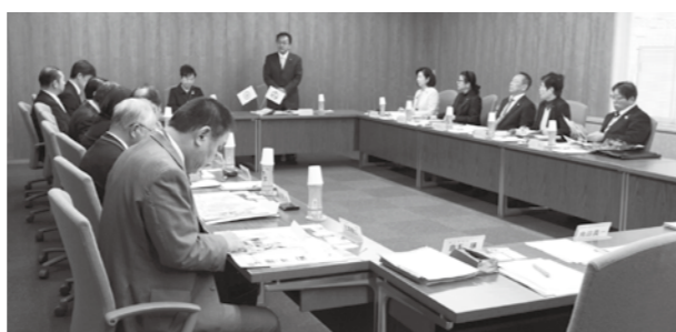
住民の声をどのように反映させるのか伺いました