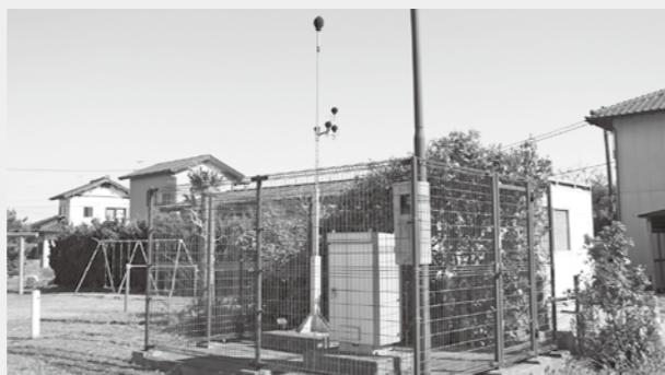
騒音の測定を行っている施設