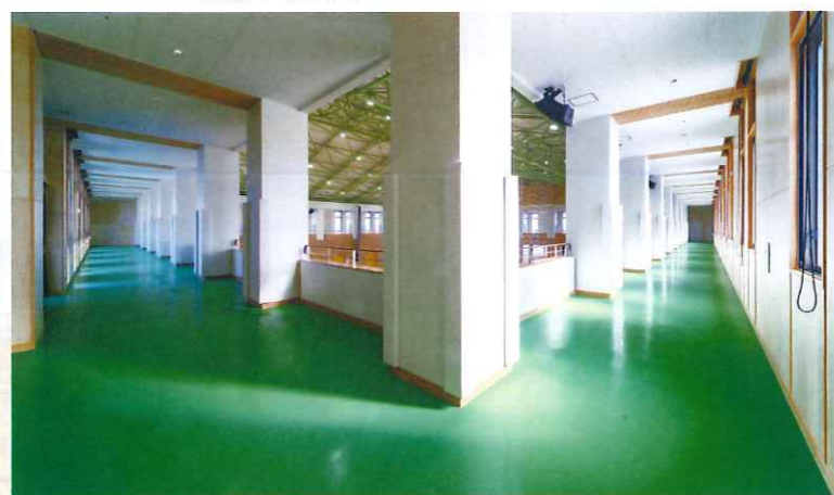
ギャラリー (ランニングコース)