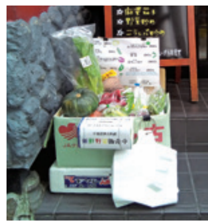
▲店先に設けた販売所

近所の方から畑を借りることにになりました。一生懸命作った野菜がたくさんできて、自分たちで食べるだけでは余つてしまふし捨てるのはもったいないというので、神保町の知り合いの店先で、野菜を販売することにしました。そのため、都内へ出勤する月曜、木曜は大きなトランクに野菜をいっぱい詰め込んで出勤しています。