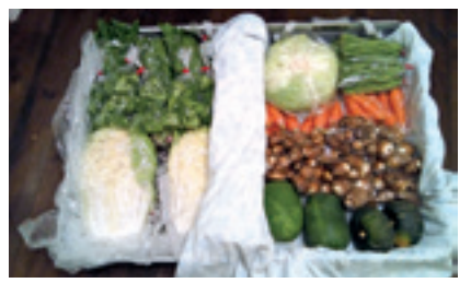
▲トランクいっぱいの野菜

近所の方から畑を借りることにになりました。一生懸命作った野菜がたくさんできて、自分たちで食べるだけでは余つてしまふし捨てるのはもったいないというので、神保町の知り合いの店先で、野菜を販売することにしました。そのため、都内へ出勤する月曜、木曜は大きなトランクに野菜をいっぱい詰め込んで出勤しています。