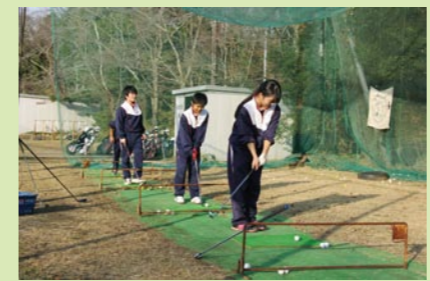
多古中ゴルフ練習場にてアプローチ練習

NHK BS-1 スペシャルプログラム 奇跡のレッスン 世界の最強コーチと子どもたち 世界の一流指導者が子どもたちに1週間のレッスンを 行い、技術だけでなく心の変化まで呼び起こす。 放送予定 「ゴルフ 前編」2月 5日(日) 「ゴルフ 後編」2月 12日(日) いずれも、午後11時～11時49分放送