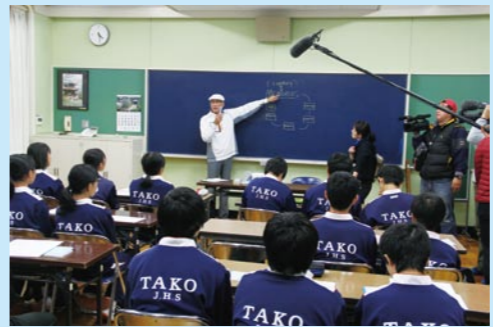
ゴルフを楽しむための成功の円を学ぶ生徒たち

今の取り組みを続けていってください。多古中ゴルフ部は素晴らしいプログラムを育んでいます。内外のコーチや先生方の深い関わりや協力によって、より良いゴルフ部へ成長を続けています。これから先も地域の支えに感謝し、努力を続けてください。