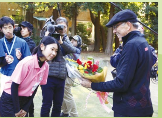
花束を受け取るルディコーチ

アメリカ・カリフォルニア州出身。ゴルフ指導歴45年。史上最高のゴルファーといわれるタイガー・ウッズを4歳から10歳まで指導し、基礎をつくりあげた。タイガーが持っていた能力に加え、ゴルフをとことん「楽しむ」方法を教え込み、天才ゴルファーへと開花させた。ほかにも多くのプロを育て、全米ゴルフ協会からジュニア育成に多大な貢献をした人物に贈られるカード・ウォーカー賞を受賞。ゴルフ大国アメリカが誇る最強のジュニア指導のエキスパート。