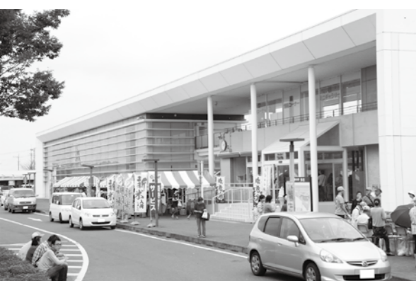
体験イベントによる観光客の呼び込みを（道の駅）

本町の観光においては、来訪者の受け入れ体制が十分とは言えない状況で、観光振興を担う人材の育成も課題であり、推進母体として観光協会などの検討が必要だと思います。今年度、観光アドバイザーの助言をいただきながら、観光に係る団体と協議を重ねていきます。