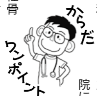
からだのポイント

高齢者の骨粗しょう性骨折の定型的部位は①足の付け根②背骨③手首④腕の付け根です。この中でも①足の付け根と②背骨は特に要注意で、日常生活に重大な支障を来す可能性があります。