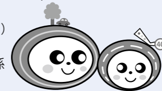
町道イメージキャラクター たこみちくん と きずなちゃん

■自動車税は納付期限(6月1日)までにお支払いを■ 5月上旬に自動車税事務所から納 税通知書が発送されます。インターネットを利用したお支払いも可能ですので、詳しくは同封 のしおりをご覧ください。問合せ●香取県事務所☎0478-54-1314