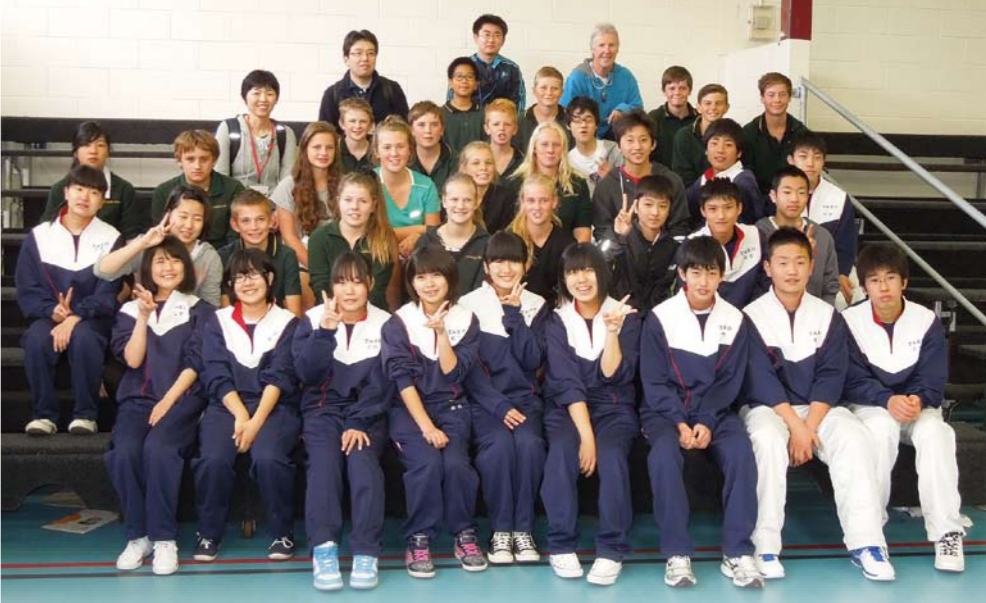
6日目の体験学習は、体育館でフィヨルドランドカレッジ9年生（日本では中学1年生）と一緒にバレーボール。最後は記念に「はいチーズ」

近年、外国との交流を通じて友好関係を築き、協力し合うことがより一層大切だといわれ、特に次代を担う青少年には、国際感覚を身に付けることが重要となってきました。 町では、国際化に対応できる豊かな国際感覚を身に付けた人材育成を目指して、平成19年度から中学生を対象とした『国際交流海外派遣事業』を行い、今年で8回目となります。 今回参加したのは多古中学校2年生18名（現在3年生）と引率者3名。3月21日から28日までの8日間ニュージーランド南島の町「テ・アナウ」を訪問し、地元学校フィヨルドランドカレッジでの体験学習やホームステイなどを通じて、現地の皆さんとの交流を図りました。