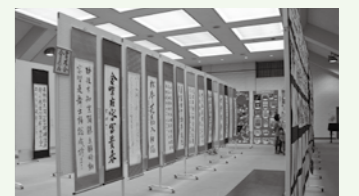
昨年の文化祭から

【各部共通】 申込期限●10月14日(火) 展示準備●10月30日(木) 午前9時から 作品搬出●11月2日(日) 午後3時から 問合せ●コミュニティプラザ内 生涯学習課文化係 ☎ 76-7811