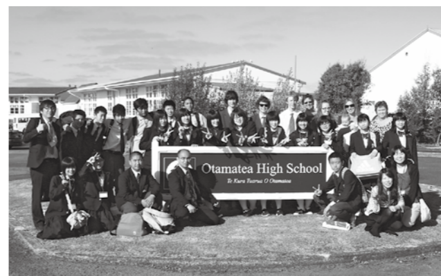
異文化を学ぶ国際交流事業

国際交流は子どもたちの世界観を醸成することにつながると考えます。外国から子どもたちのホームステイ等について成田空港周辺市町に対し期待があります。組織ができていないことで受け入れ体制がとれない現状です。世界観を変える交流ができるよう組織していきたいと考えています。