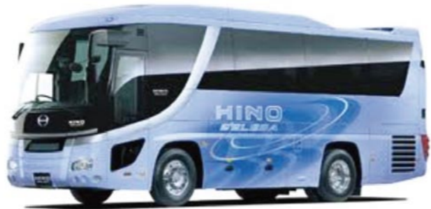
購入が決まった研修バス (デザインは未定)

研修バス「さざんか号」が安全に運行できるよう、老朽化した車両を更新する研修バス購入契約について可決しました。(契約金額：22,949,700円)