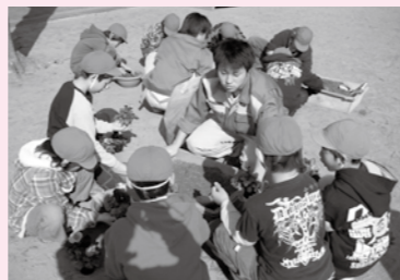
▲常磐小学校での花交流

町の出来事や頑張っている皆さんを紹介するアラカルトコーナー。 このコーナーでは、皆さんからの情報をお待ちしています。 〒289-2292 多古町役場総務課広報係 ☎76-2611