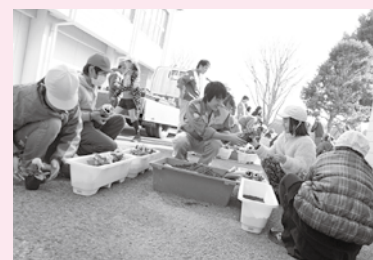
▲久賀小学校での花交流

2月17日、久賀小学校で4年生を対象に、多古高生産流通科の2年生と花交流が行われました。昨年、一緒にまいたパンジーの種は、高校のハウスで生徒達に管理されて、きれいに花を咲かせました。プランターに植え替えて校舎の周りに飾られた花々に、春の訪れを感じられた1日となりました。25日には常磐小学校の4・5年生とも行われました。