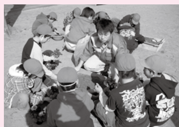
▲常磐小学校での花交流

町の出来事や頑張っている皆さんを紹介するアラカルトコーナー。 このコーナーでは、皆さんからの情報をお待ちしています。 〒289-2292 多古町役場総務課広報係 ☎76-2611