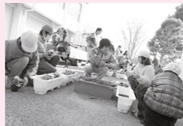
▲久賀小学校での花交流

2月17日、久賀小学校で4年生を対象に、多古高生産流通科の2年生と花交流が行われました。昨年、一緒にまいたパンジーの種は、高校のハウスで生徒達に管理されて、きれいに花を咲かせました。プランターに植え替えて校舎の周りに飾られた花々に、春の訪れを感じられた1日となりました。25日には常磐小学校の4・5年生とも行われました。