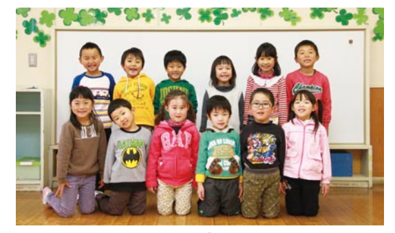
久賀幼稚園 さくらぐみ(4歳児) ゆりぐみ(5歳児) 『虹のおこうに』 「久賀幼稚園最後の思い出に大好きな歌を思い浮かべて、みんなで力を合わせて作りました」