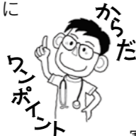
からだのポイント 背伸びするだけでも、体が温かくなって、頭がさえてくるね。

軽い運動をすることで、ストレスを発散できることはよく知られています。人間は暗い気持ちと明るい気持ちを同時に持つことができないため、運動により高揚感が満たされると、気分全体が引つ張られて明るい気持ちになるからです。テレビなどで健康法や健康食品を