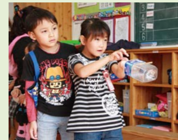
輪ゴムで数字を当てる 「ねらったのしいおみせやさん」

体育館では、上級生が日頃腕を磨いている和太鼓の演奏が披露された後、あんこやきな粉、お雑煮などが用意され「おいしい！」と何杯もおかわりする姿が見られました。地域が一体となったおいしい笑顔でいっぱいのお祭りになりました。