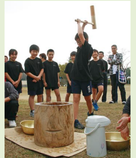
ねらいはうすのど真ん中！ 「児童全員による餅つき」