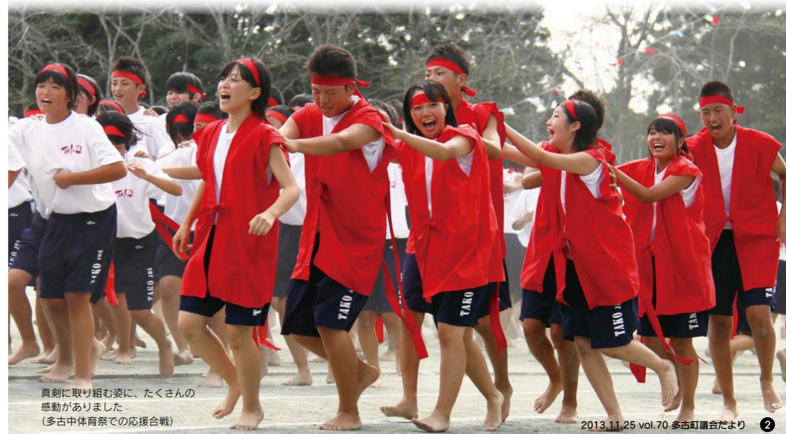
真剣に取り組む姿に、たくさんの感動がありました (多古中体育祭での応援合戦)