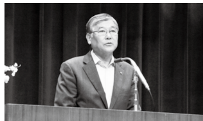
7月3日 社会を明るくする運動推進大会 開会式であじさつ