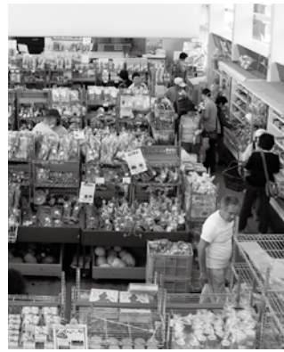
買い物客で賑わうあじさい館

られたもので、機能的に不十分な状況下での運営であり、今後は新たな事業展開等も検討したいと思えます。