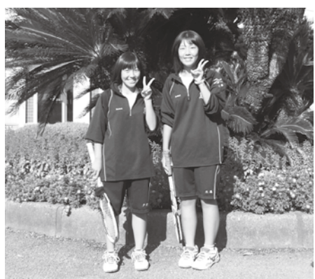
体育の授業を終えて(多古高生)

教育長 学校運営協議会の役割は、人事と学校予算を県に要求できるということです。魅力