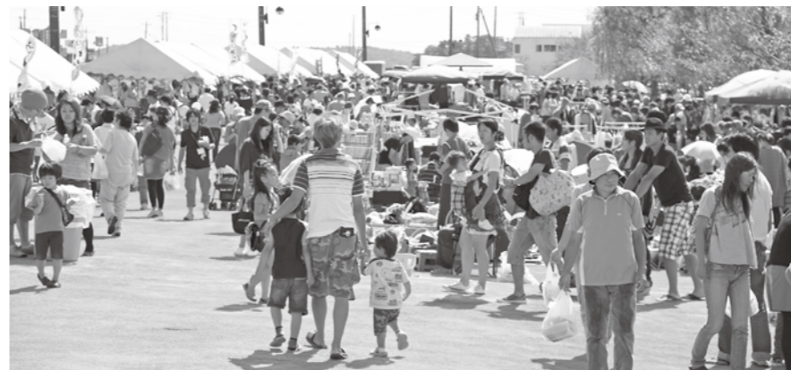
大勢の人でにぎわう会場

台風18号が接近していましたが、会場には例年にも増してたくさんの方が訪れ、祭りは最後まで大盛況となりました。