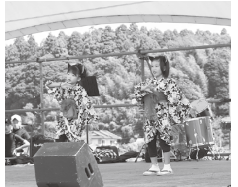
ステージで舞う「錦照会」