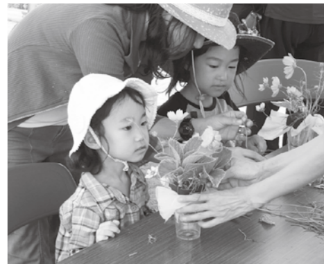
フラワーアレンジメント