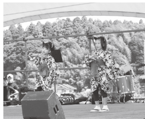
ステージで舞う「錦照会」