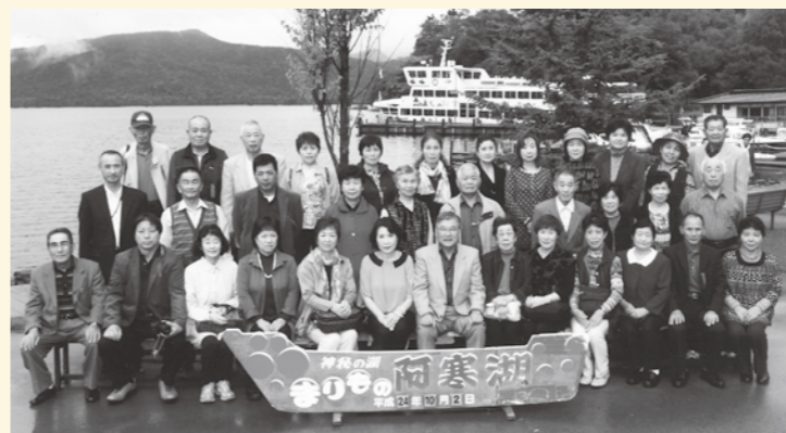
阿寒湖で記念撮影

9月30日から10月2日、2泊3日で『多古町民ふれあい号』の旅が行われました。この旅行は、町民の絆を大切にすることと町民相互の親睦を図るために行われ、第30回を迎えた今回は「大自然!! 世界遺産・知床と道東周遊の旅」として、定員を大幅に上回る102人の参加がありました。