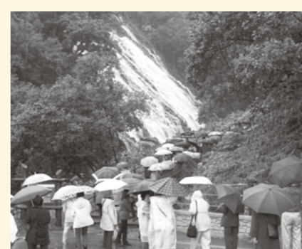
雄大に流れる「オシンコシンの滝」

知床八景の「知床五湖」や「知床峠」、そして日本の滝100選にも選ばれた「オシンコシンの滝」などの観光で、世界自然遺産「知床」の大自然を感じた旅行となりました。