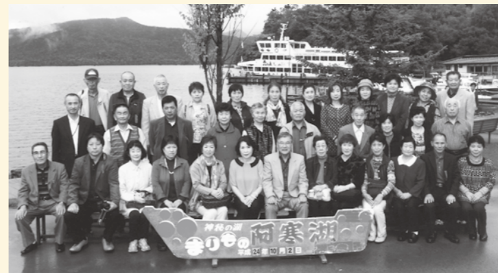
阿寒湖で記念撮影

9月30日から10月2日、2泊3日で『多古町民ふれあい号』の旅が行われました。この旅行は、町民の絆を大切にすることと町民相互の親睦を図るために行われ、第30回を迎えた今回は「大自然!! 世界遺産・知床と道東周遊の旅」として、定員を大幅に上回る102人の参加がありました。