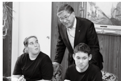
『国際交流事業』 ニュージーランド訪問団の表敬訪問