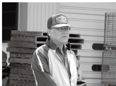
「都市と農村との交流事業」 田植え体験であいさつ