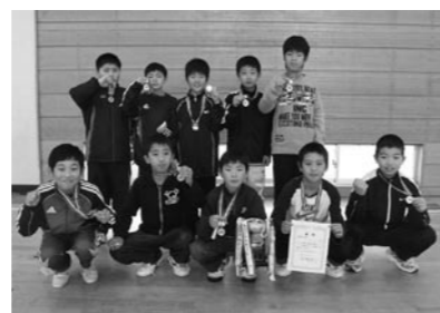
高学年の部優勝「ときわチキンボーイズ」