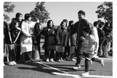
お父さんと一緒にゴール