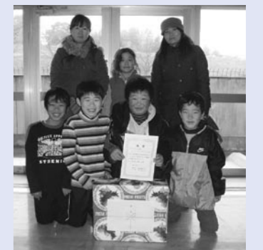
ファミリーの部 優勝 「ファイヤードラゴン富山チーム」