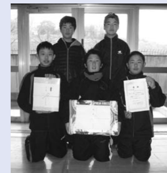
子どもの部 優勝 「うさぎさんもたつんだ」