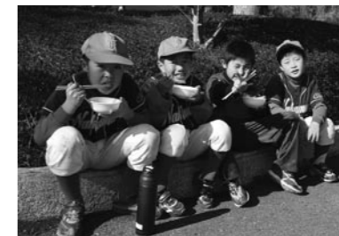
頑張った後の豚汁はおいしい！