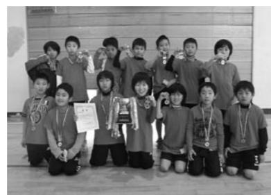
低学年の部優勝「デザートライオン」