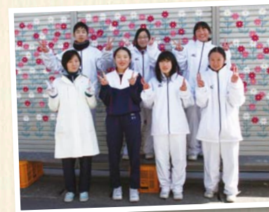
←シャッター画制作に取り組んだ「多古中学校美術部」