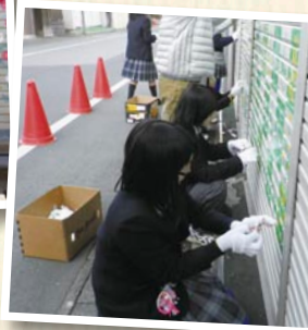
シャッター画制作中の「多古高校美術部」 →

今後、多目的コーナーの一角を利用して、介護予防教室や健康増進を目的とした各種教室などを行っていく予定です。