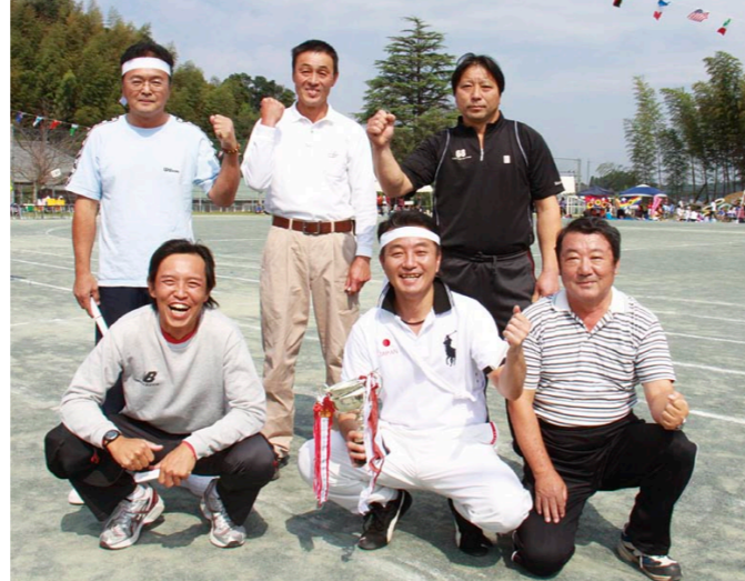
▶賞杯を手に喜びの6人の選手

10月8日、さわやかな秋空の下、多古町民大運動会が開催されました。議会からも特別レースに参加し、6人の代表が健脚を披露しました。スタートからゴールまで1位でバトンをつなぎ、見事優勝を飾りました。バンザイ。