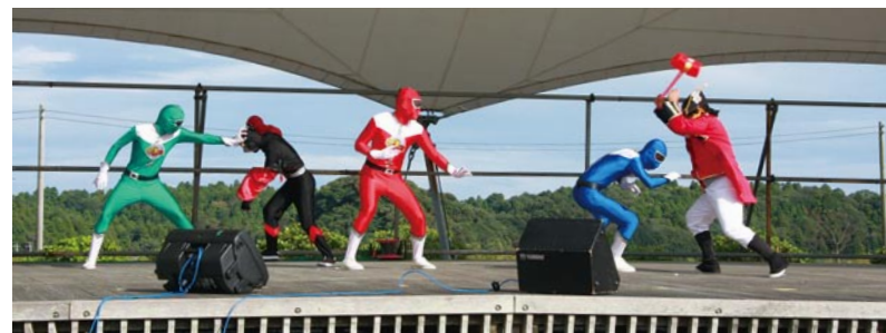
小さいお子さんに大人気！環境戦士3Rショー

今年は、無料配布された炊きたての多古米に、各テントで販売しているおかずを乗せ、自分流の丼ぶりを作る『秋だ！多古米チョイのせ丼!!』が大好評。フリーマーケットやコスモスを使つてのフラワーアレンジメントなどにもたくさんの方が参加されました。ステージ上では、環境戦士3Rショーなど、たくさん出演者で盛り上がりを見せました。来年のコスモス祭りも楽しみですね。