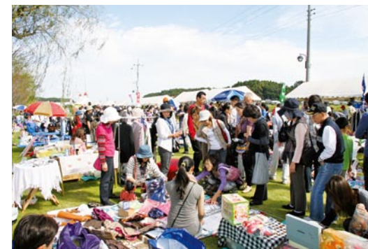
たくさんの人でにぎわうフリーマーケット