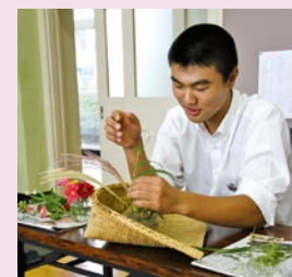
華道教室で花を生ける

9月29日、多古中学校やコミュニティプラザ、保健福祉センターを会場に『道セミナー』が開催されました。多古中学校3年生が参加したこのセミナーは、生徒の文化的教養の向上と地域住民との交流を目的とし、今年で10回目を向かえました。