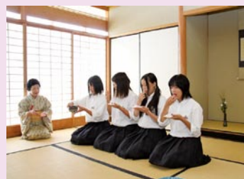
茶道教室で作法を習う