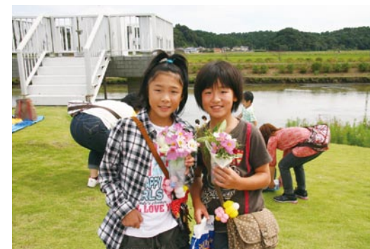
コスモスでフラワーアレンジメント